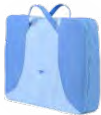
Bolsa para el kit NT